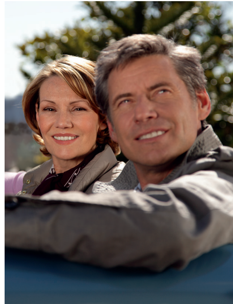
Die vielleicht schönste Verbindung zwischen zwei Punkten ist eine sanft geschwungene Linkskurve.